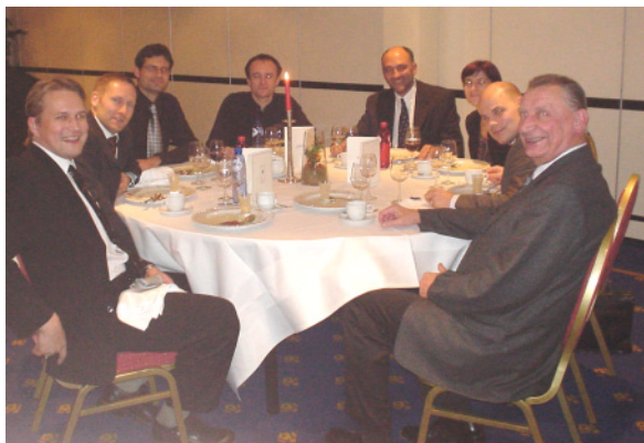
Najpomembnejše stvari se na skupščini dogovorijo med delovnimi večerjami v družbi predsednikov nacionalnih društev, predsednika programskega odbora za ENS konference in predstavnikov YGN.

Drugi vir dohodkov so konference. Letošnja konferenca PIME 2004 je prinesla precejšnjo izgubo. Razlogi so v neprimerni izbiri lokacije (hotela) in v majhnem številu konferenc, ki jih organizira ENS. Za naslednje leto ciljamo na večjo številko, saj se v tem primeru stroški sekretariata porazdelijo. Koledar konferenc je tako za naslednji dve leti v glavnem že zapolnjen, obstaja pa še možnost za organizacijo konference v sodelovanju z ENS od leta 2007 dalje.